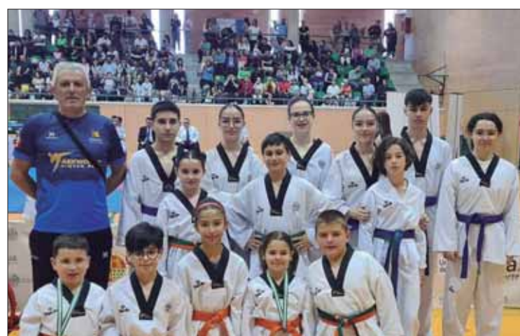
La doble cita de Jaén contó con 15 representantes del club/EC

En esta doble cita hubo quince integrantes del Club Deportivo Gimtar. Los representantes locales participaron en diferentes categorías, según edad y cinturón. El balance final para el club ruteño fue de tres medallas de oro, otras ocho de plata y