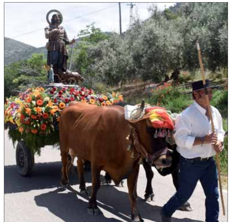
San Isidro fue en un carro tirado por bueyes

Lo que sí se repitió en relación a la mañana fue el hecho de que San Isidro fue en un carro tirado por bueyes. Es una característica tradicional de estas fiestas que apenas se conserva en algún sitio más