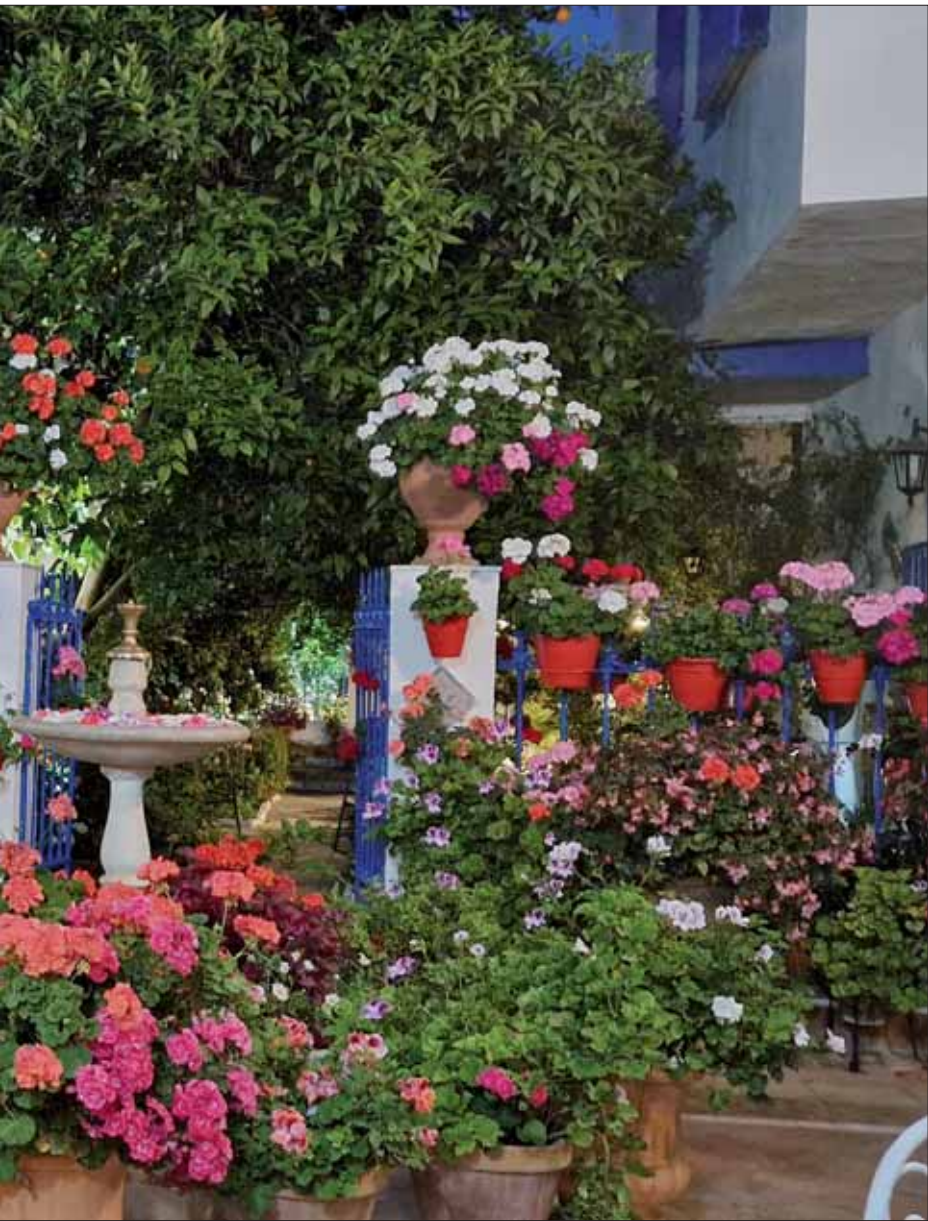
Primer premio de la comarca y el segundo de la provincia/MM

dad de sus propietarios y cuidadores que abren las puertas para compartir y mostrar lo bueno y bonito de sus casas. Según dijo, es un acierto saber poner en valor “aquello que nos hace especiales”. En este sentido, cree que la comarca es “un lugar privilegiado”, que hace que el viajero disfrute del entorno que le rodea. Para el presidente de la Mancomunidad, el desarrollo turístico y empresarial han de ir coaligados. De ahí que responsables públicos y políticos, hosteleros, guías turísticos, técnicos y cuidadores de patios deban trabajar e ir de la mano.