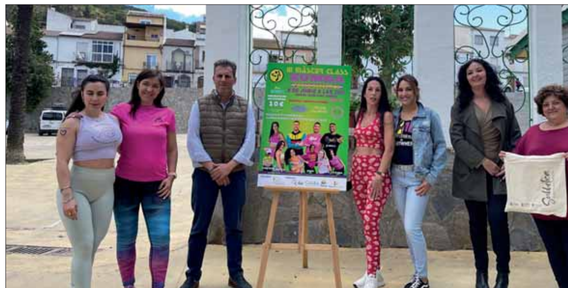
El Paseo del Fresno acogerá esta jornada en torno a la zumba/FP

Al igual que en las dos primeras entregas, se llevará a cabo en el Paseo del Fresno, en el espacio de la Caseta Municipal. Dado que mantiene el mismo formato y similares propuestas complementarias, el concejal