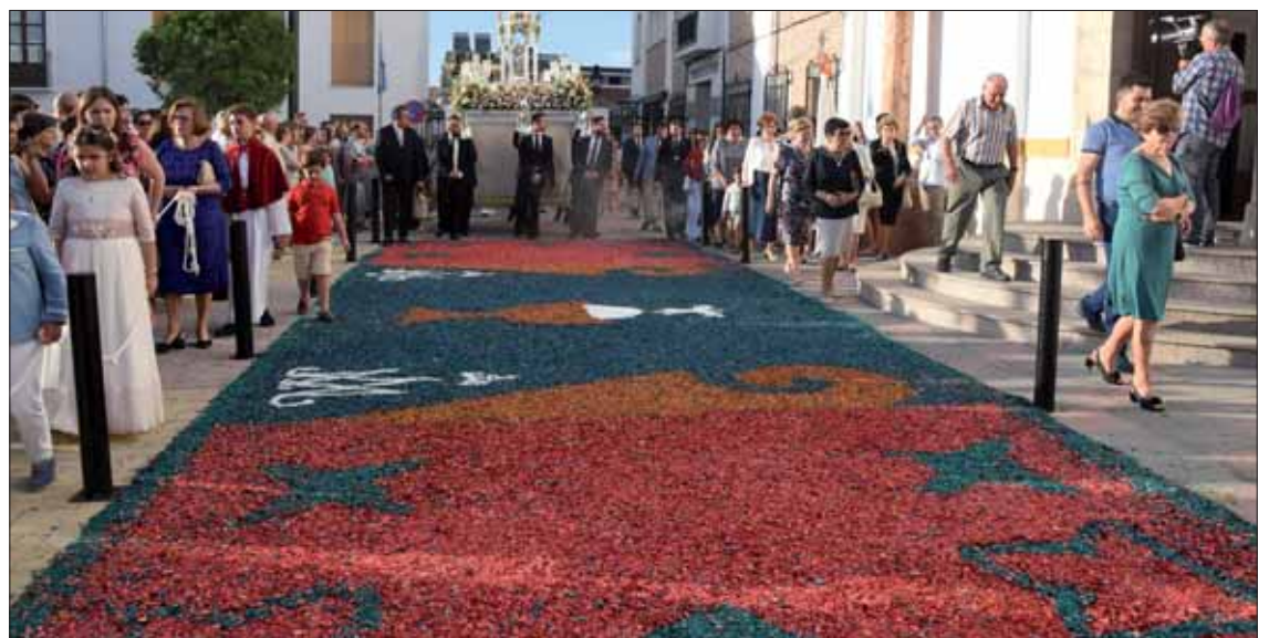
La alfombra ante la puerta principal de San Francisco era una de las tres que había en el recorrido

Algo más arriba, en la esquina de las calles Fresno y Colón, ante su sede, la cofradía de Jesús de la Rosa había colocado su altar, encabezado por una imagen de Santo Domingo que hay igualmente en San Francisco. Siguiendo el itinerario, ante la puerta principal de la parroquia, en la plaza Nuestra Señora de la