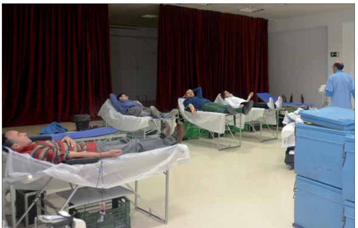
La unidad móvil del Centro Regional de Transfusión Sanguínea suele instalarse en la Ludoteca/Archivo

Entre la capital y la provincia, en 2023 se efectuaron 516 colectas, que atendieron a 33.554 donantes, de los que 2.219 eran nuevos. De ahí se obtuvieron 29.180 donaciones de sangre y 1.310 de plasma. De esta forma, el índice cordobés en 2024 fue de 40 donaciones por cada mil habitantes al año, mientras que el del resto del país se reduce a 35.