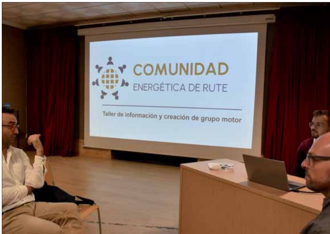
Los talleres se tematizaron para atender a los diversos intereses de cada persona o colectivo

La unión implica crear “un vehículo jurídico”, que puede tener formas legales como la asociación o la cooperativa, entre otras. Sus integrantes establecen un modelo de producción y consumo que beneficie a cada uno. En función de los perfiles, los objetivos pueden diferir, pero la idea principal es que todos los miembros perciben el ahorro económico. De igual modo, ese ahorro será mayor cuantos más componentes sumen. Asimismo, los “excedentes” como productor se pueden ceder a la ciudadanía “por un beneficio mayor que el de la comercializadora habi-