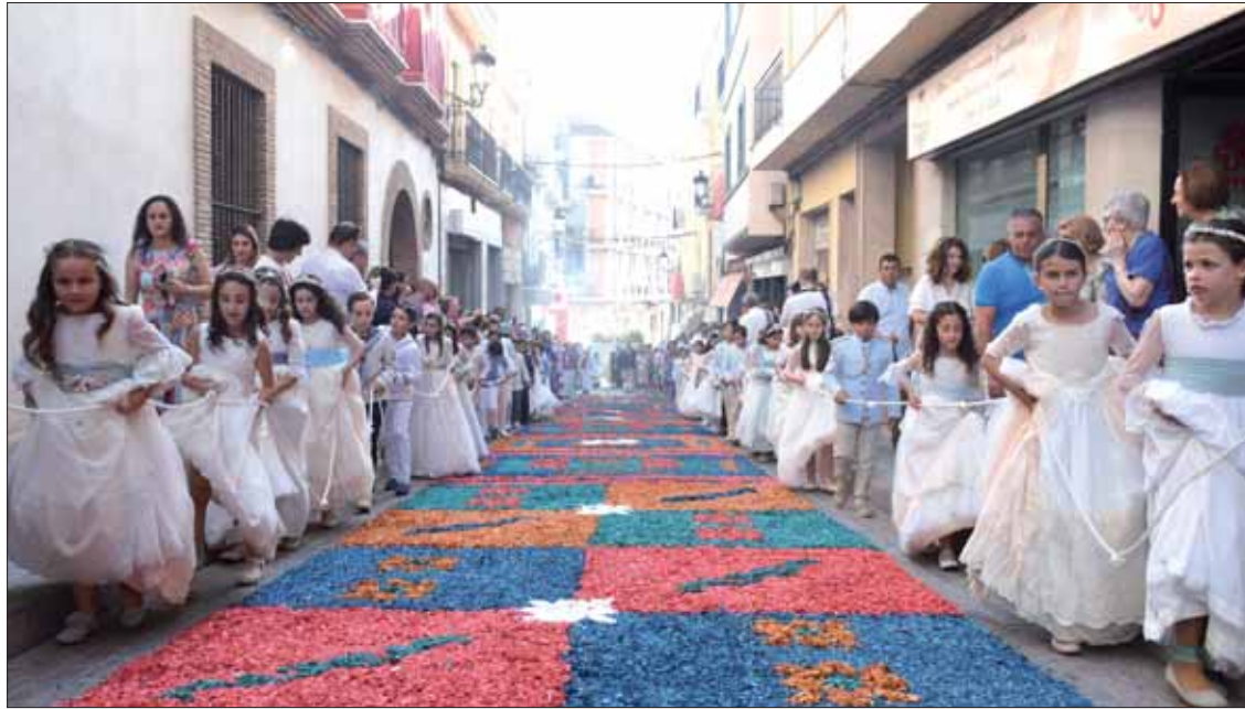
En total, 56 niños y niñas han hecho en Rute este año la Primera Comunión/FP

La comitiva, integrada por los niños y niñas de comunión, representantes públicos y cofrades, accedió por primera vez por el Chorreadero