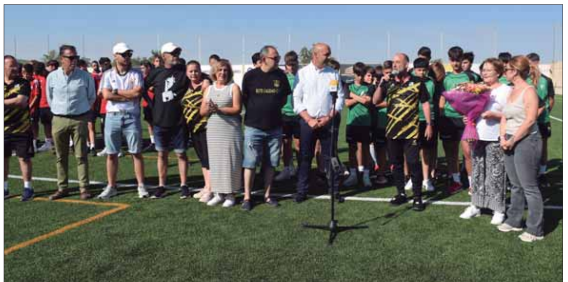
Antes del torneo se entregó un ramo de flores a la familia del añorado presidente/FP

En cuanto al torneo, en esta ocasión lo han disputado los infantiles porque cada año se apuesta por una de las categorías formativas, como "premio" a la temporada. Junto a esta sección