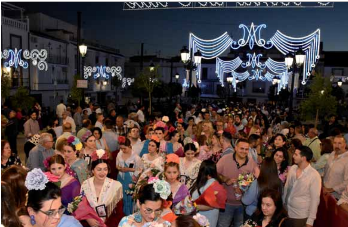
La ofrenda de flores volvió a ser una riada humana de fervor por la Virgen

triumfo de la primavera y el fervor, concentrado en un ramo.