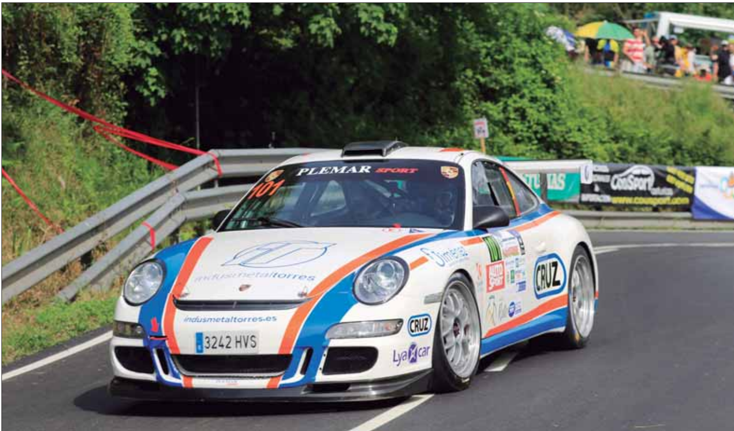
El piloto ruteño ha confirmado en tierras asturianas las buenas sensaciones que ya tuvo con el Porsche en la Subida a Ubrique