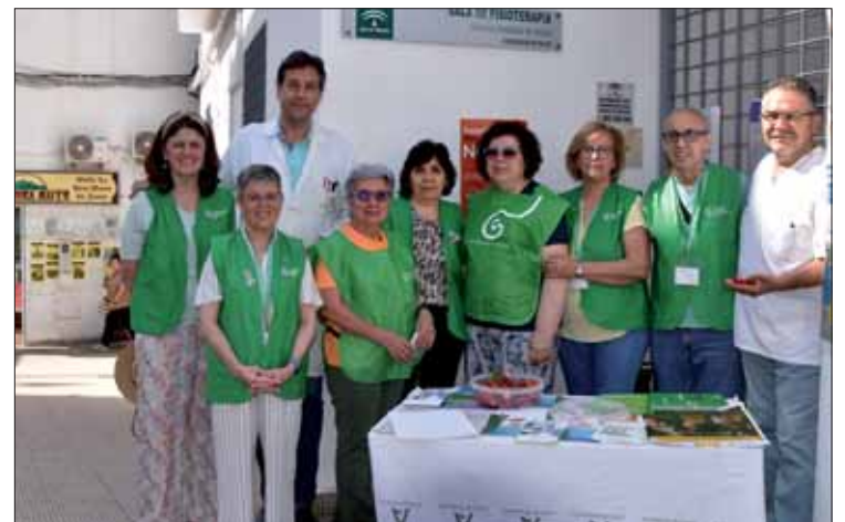
La asociación colocó una mesa informativa en Centro de Salud/MM

El coordinador del programa de tabaco del Centro de Salud coincide con la necesidad de aumentar los espacios protegidos y