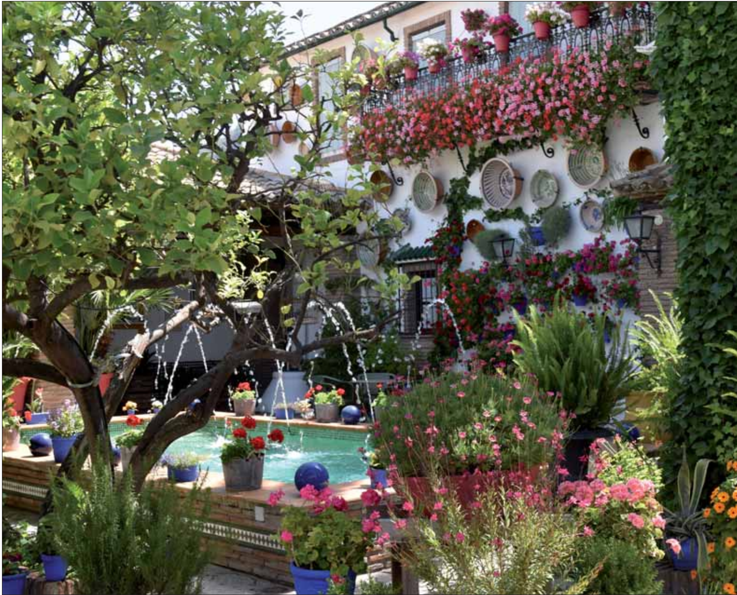
El Patio con Duende de Anselmo Córdoba se ha vuelto a alzar con el primer premio del concurso provincial