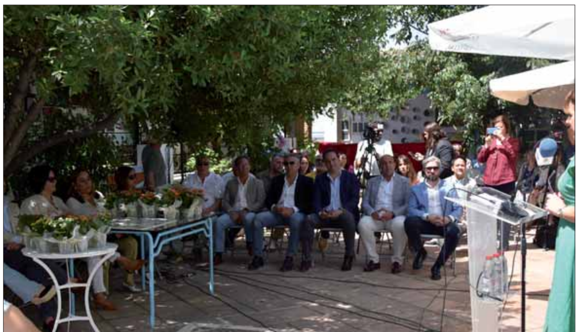
Al acto de entrega del concurso comarcal acudieron representantes públicos de la Mancomunidad/MM