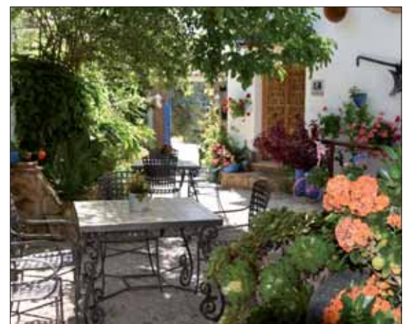
Rincón de Carmen/F. Aroca