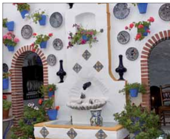
Patio del Cristo de la Misericordia