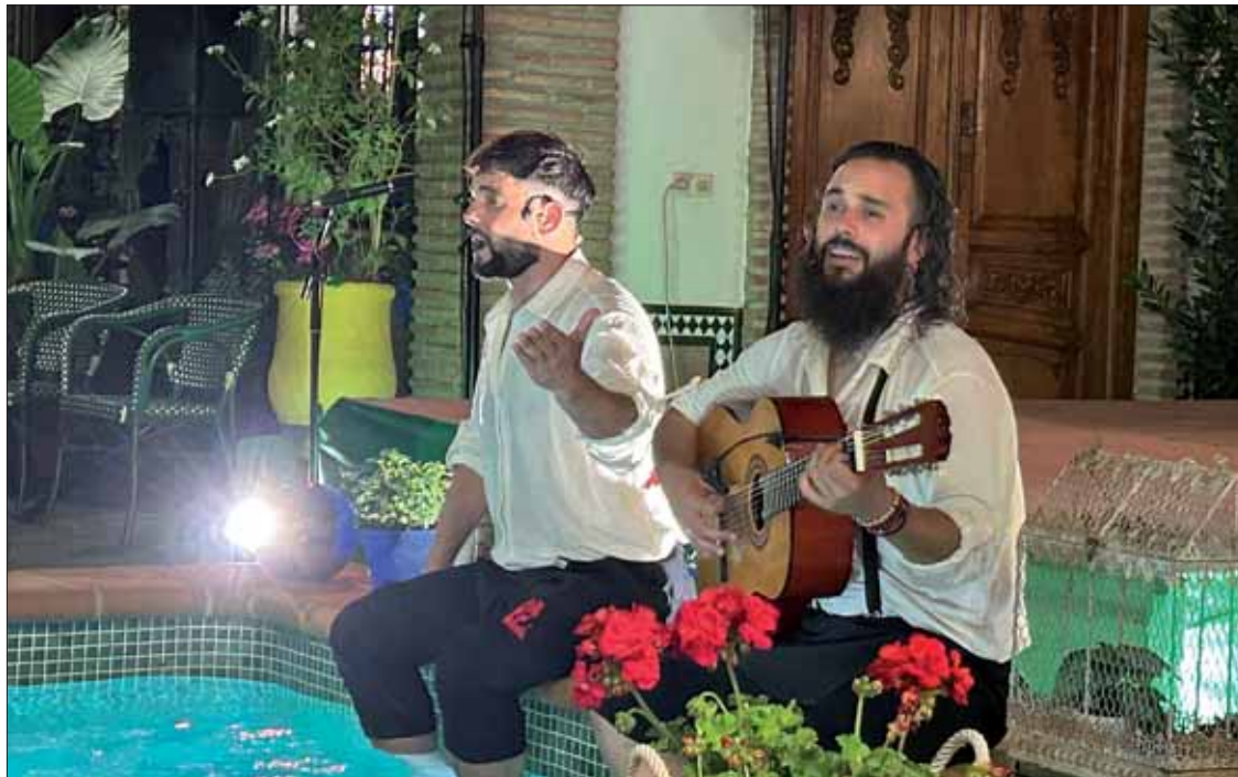
El ciclo se inauguró el 31 de mayo en el Patio con Duende, con la obra "Duros a pesetas"

La primera entrega fue la del Patio con Duende de Anselmo Córdoba, con la puesta en escena de "Duros a pesetas", una historia en clave de comedia, combinada con canto, baile y toque. El