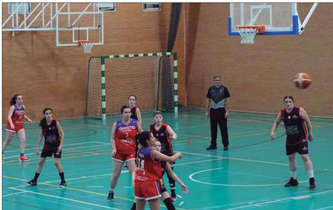
Uno de los últimos encuentros disputados en casa contra Maristas de Córdoba/EC

Esas limitaciones han sido el sino de ese grupo que se ha man-