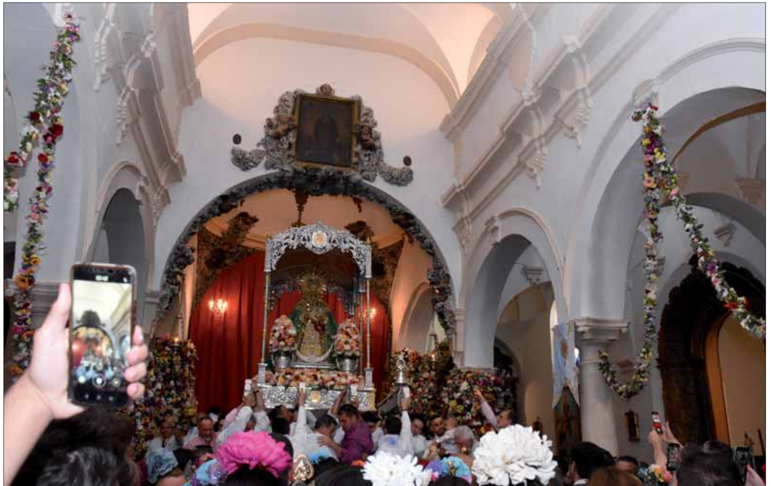
Con la bajada de la Morenita, la gente siente que el sueño de un año esperando se hace realidad

Cuando abril agoniza Rute renace y sueña con recibir a los Hermanos de Andújar para dar el pistoletazo de salida a estas Fiestas de Interés Turístico Andaluz. Es el sueño de siglos de camino y Molina, muchos sueños en uno solo. En él confluyen anhelos y aspiraciones de quie-