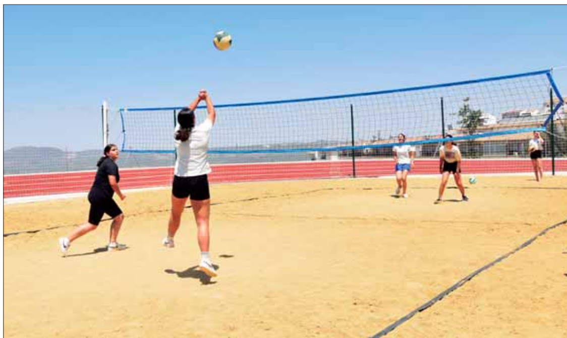
El torneo se celebró en la pista de vóley-playa del nuevo complejo deportivo municipal

La finalidad de esta guinda era doble. Por un lado, se pretendía que fuera una jornada festiva y de convivencia a través del deporte. Por otra parte, para muchas de estas jóvenes ha sido su primer contacto con la competición.