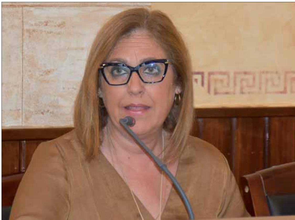
La concejala de Igualdad durante su intervención en el pleno de mayo

Asimismo, en el pleno de mayo tuvo lugar el sorteo de las