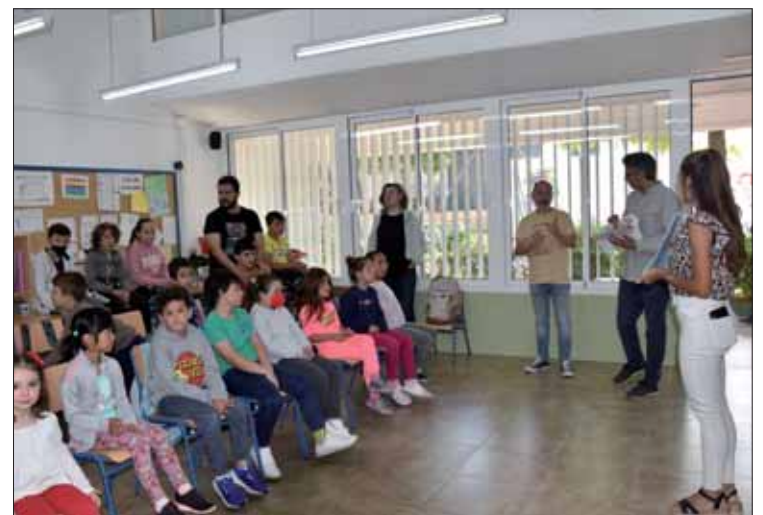
Los responsables del Parque durante la presentación del concurso

La iniciativa se presentó coincidiendo con la conmemoración del “Día del fósil” que se celebra en Europa cada 21 de mayo. Una efeméride que se celebra, explicó Antonio García, en recuerdo de una mujer que nació