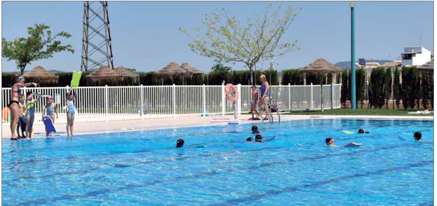
Desde primera hora los turnos de los cursos de natación están cubiertos ante la amplia demanda

Desde el último fin de semana de junio está ya plenamente operativa la piscina municipal de Rute. Ha habido, pues, una demora de algo más de una semana respecto a las fechas iniciales de apertura. Una de las intenciones del equipo de Gobierno era ampliar las fechas para disfrutar de los baños. El plan era inaugurar la temporada a mediados de junio y mantener la instalación abierta hasta el 15 de septiembre. También se pretendía prolongar los horarios. Sin em-