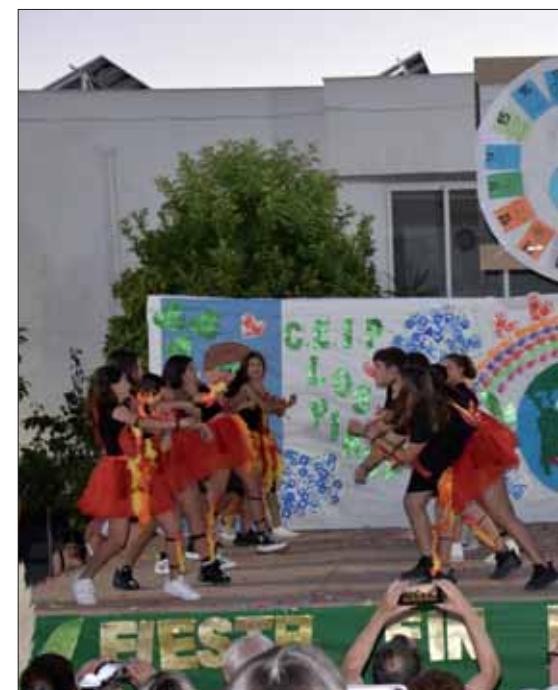
El alumnado de Pinos preparó actuaciones para c...