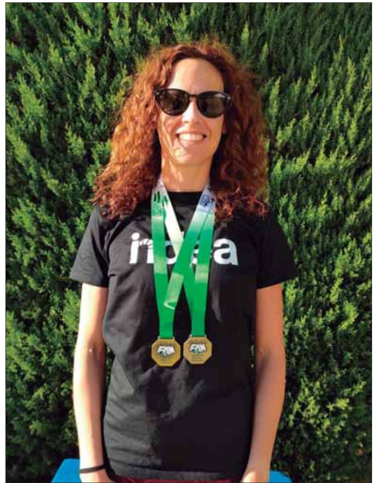
La nadadora ruteña ha hecho un balance muy positivo de esta cita/EC

Otro aspecto destacable es que ha hecho muy buenos tiempos en pruebas de corta y media distancia, lo que da idea de su versatilidad. Según matiza, con el tiempo su estilo y sus condiciones han evolucionado de ser mejor en velocidad a rendir más