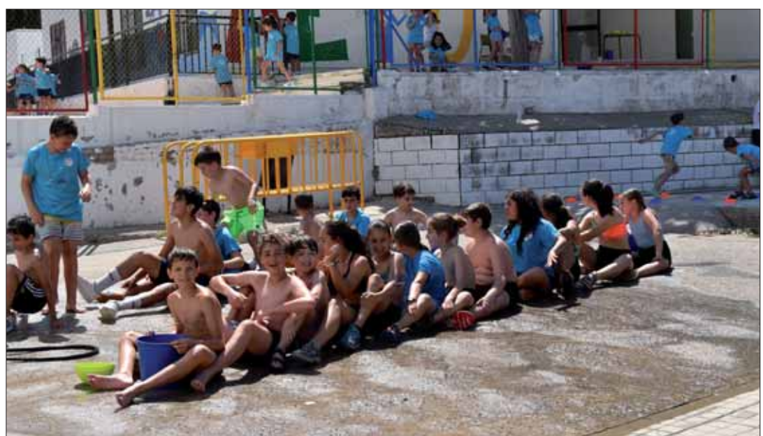
El alumnado del colegio de Fuente Moral disfrutando de las actividades/MM