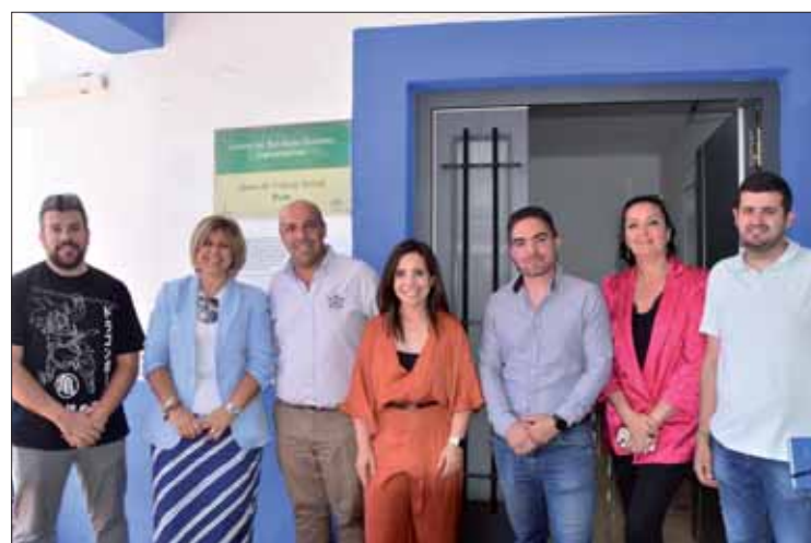
La delegada junto a los alcaldes y responsables municipales de la comarca/MM

Según la delegada provincial "las cuestiones que tienen que ver con las demandas sociales son las que más llegan a los despachos de Alcaldía y a los Ayuntamientos". Por eso, con este tipo de jornada y reuniones, se pretende también conocer qué programas funcionan y cuáles son necesarios implantar. Las valoraciones y asignaciones correspondientes al desarrollo de la Ley de Dependencia son de los recursos