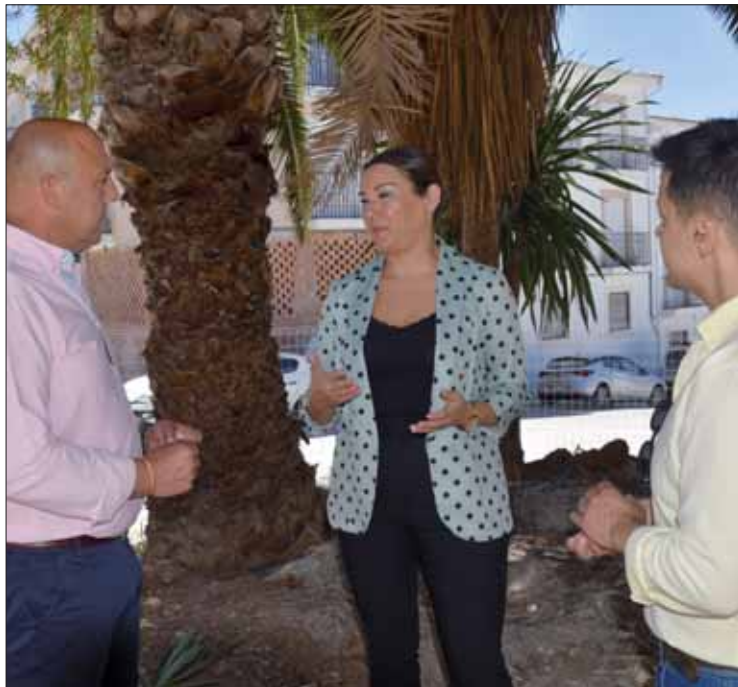
La delegada acompañada por el alcalde y el teniente de alcalde/MM

La mejora de los jardines, zonas verdes y de toda la barriada que rodea la calle Libertad es uno de los objetivos que se ha planteado el Ayuntamiento de Rute con cargo al Programa de Fomento del Empleo Agrario (PFEA) y a través de un total de cuatro fases. En noviembre del año pasado concluía la segunda y ahora, en junio, ha comenzado a ejecutarse las obras de la tercera fase, con cargo a los planes del ejercicio 2023. En este caso, la inversión total asciende a cerca de cuatrocientos once mil euros.