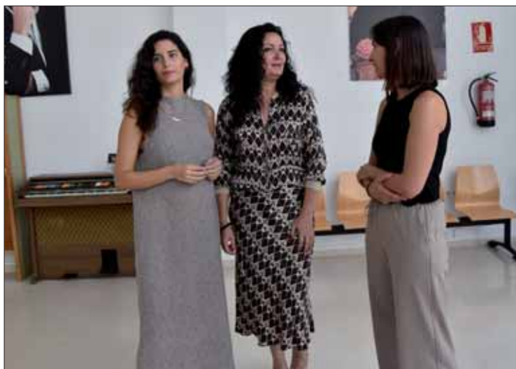
El grupo que se ha dado a conocer ahora operará en la Ludoteca/FP

La iniciativa se enmarca dentro de la oferta del Instituto An-