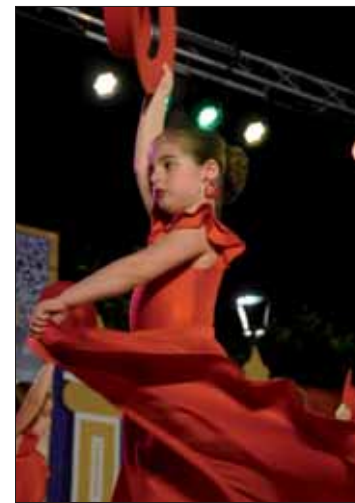
El flamenco sigue presente

"Las niñas ya no quieren ser princesas", cantaba Sabina cuatro décadas atrás, anticipando la coda final del festival. Alguna, parafraseando a ABBA, es ahora toda una "reina del baile", acompañada con el maestro al son del vals número 2 de Shostakovich, pero siempre por decisión y voluntad propias. No en vano, Leal insiste en que la asistencia a las clases no conlleva la obligación de subir luego al escenario. Hasta en eso es fiel a su filosofía de divertirse y disfrutar con el arte.