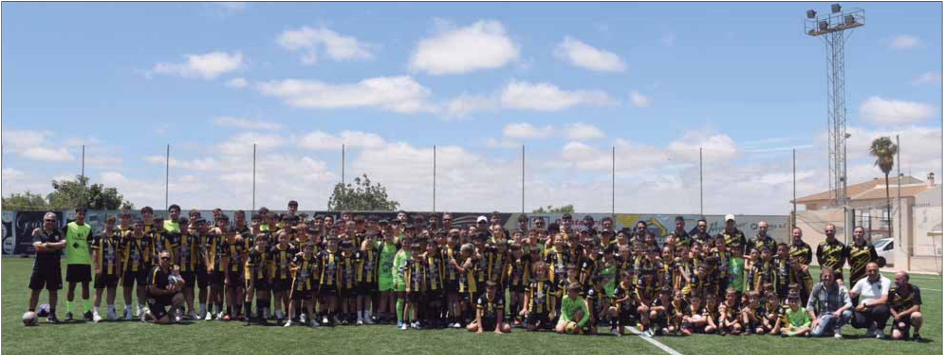
La llamada "familia del Rute Calidad" ha estado integrada esta temporada por ocho secciones que han dado cabida en sus filas a unos ciento cincuenta jugadores/FP