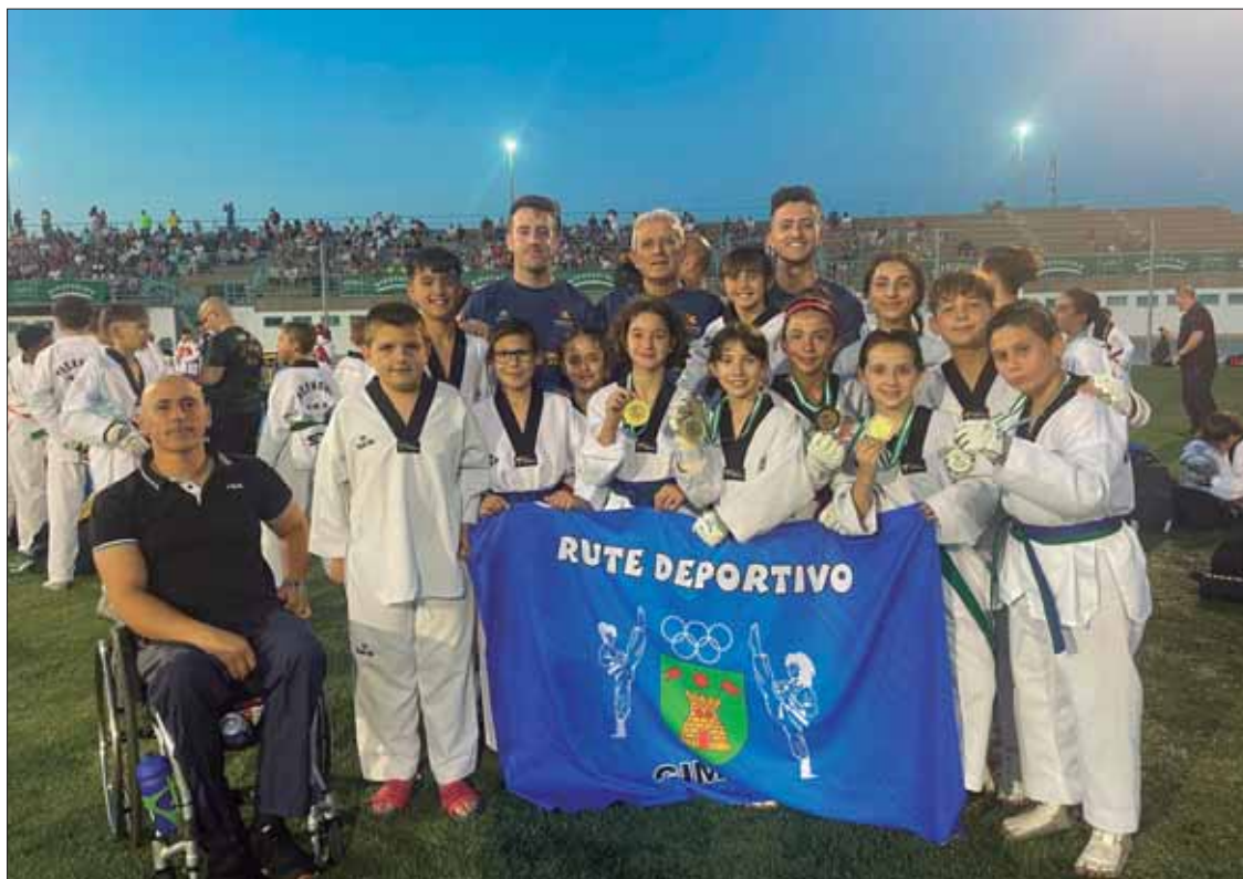
La expedición ruteña sumó seis medallas en esta última competición de la temporada/EC