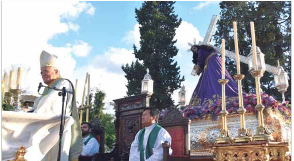
El obispo de Córdoba, Demetrio Fernández González, durante la homilía

A continuación, el alcalde de Rute, David Ruiz, en nombre de toda la Corporación municipal, hizo entrega de una medalla conmemorativa a la cofradía ruteña, como muestra de respeto y admi-