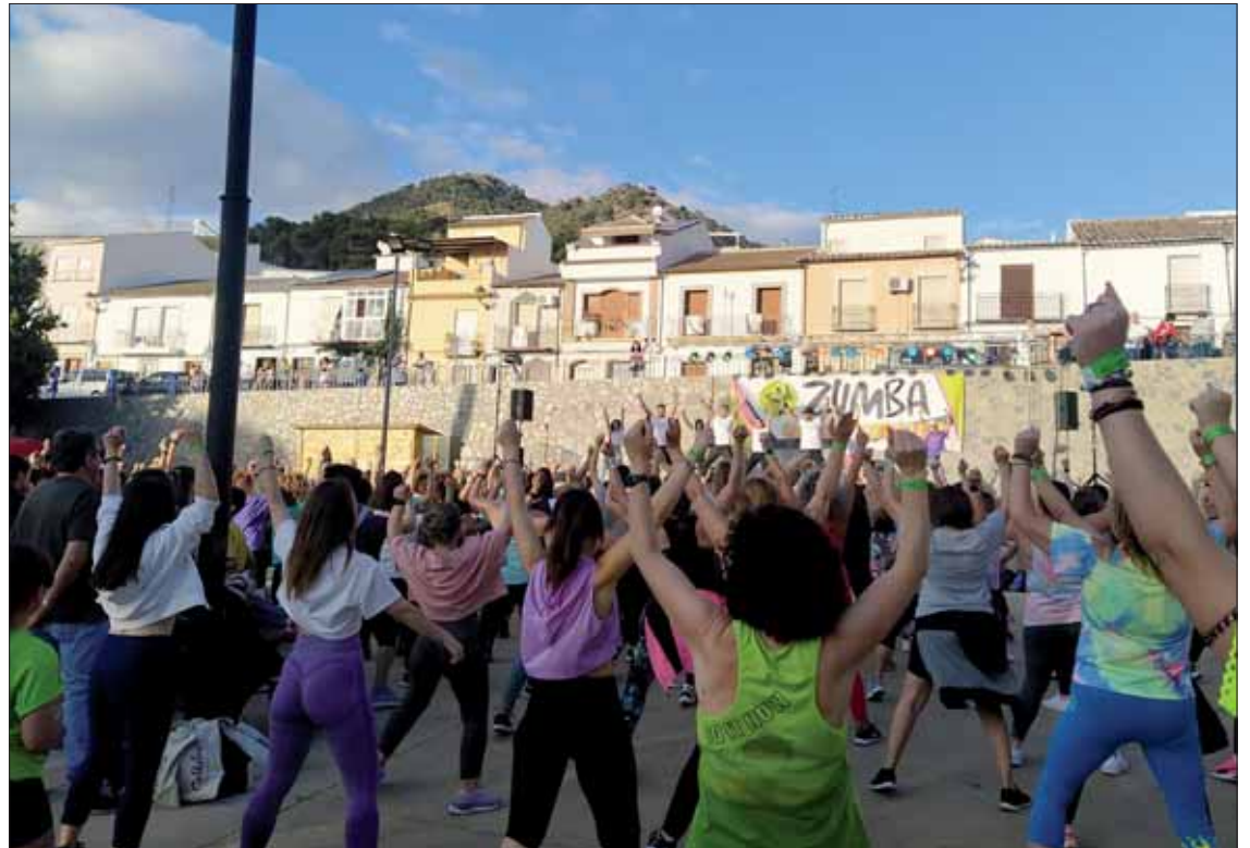
La master class se llevó a cabo en el Paseo del Fresno/MM

tos a los que habitualmente están acostumbrados. Además, Toñi Pedrazas aclaró que "todos los instructores e instructoras contaban con su certificación oficial para impartir este tipo de práctica"