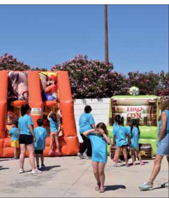
Los triunfaron en el último día del curso/MM