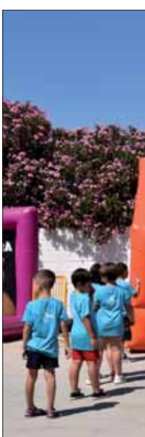
Los juegos acuáticos