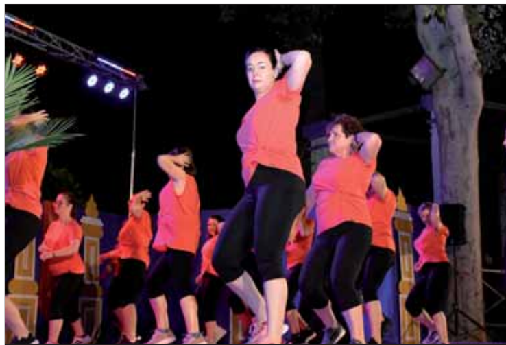
El repertorio ha incrementado los números de zumba/FP