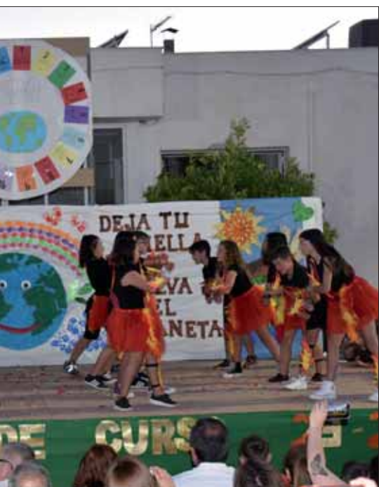
Concienciar sobre el medio ambiente