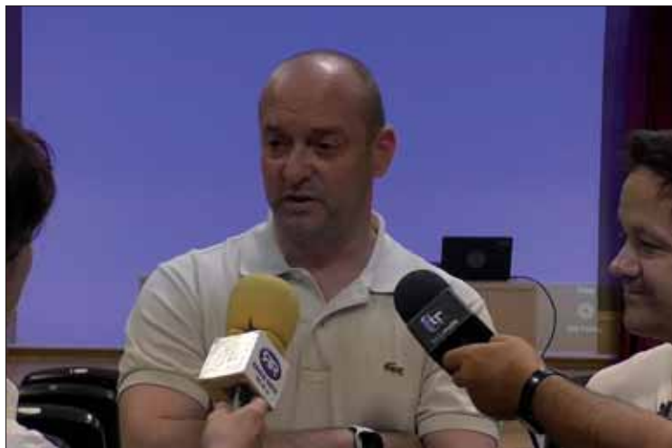
El teniente de alcalde acompañó al jefe del equipo @ de la Guardia Civil/MM