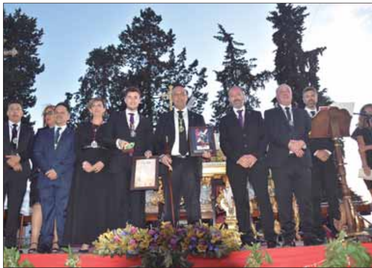
El alcalde entregó, en nombre de la Corporación, una medalla/F.Aroca