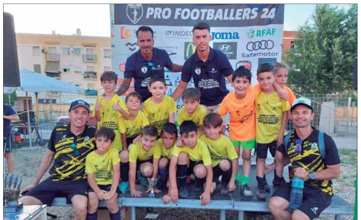
La base del equipo ruteño en este torneo ha sido la misma que ha competido en la liga regular/EC

Los veinte inscritos estaban divididos en cinco grupos. En cada uno, había una liguilla, con partidos de veinte minutos. Los primeros de cada grupo accedían