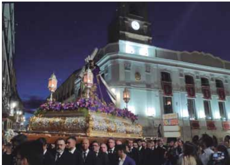
Una imagen insólita del Nazareno en su recorrido extraordinario

ración del pueblo de Rute a esta sagrada imagen titular. Un reconocimiento que, para los miembros de la cofradía, supone valorar la devoción y esfuerzo colectivo que han venido realizando desde hace cuatrocientos años. Según