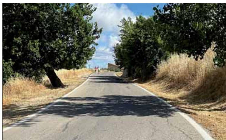
Decenas de personas transitan esta vía, a diario, para andar o correr